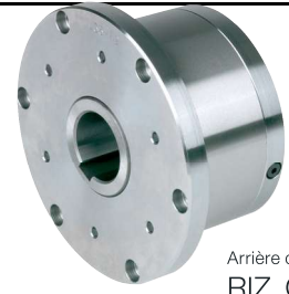
Arrière de RIZ..G1G2