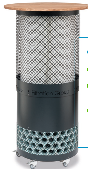
SilentCare Variante als Stehtisch